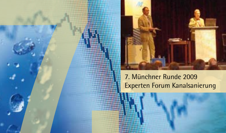
7. Münchner Runde 2009 Experten Forum Kanalsanierung